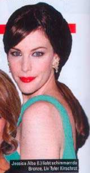
Jessica Alba (l.) liebt schimmernde Bronze. Liv Tyler (rechts)

V.o.n.u.: Color Fever Shine „104“ von LANCÔME, um 25 Euro, Wanted Shine „37“ von HELENA RUBINSTEIN, um 26 Euro, Rouge Allure „46“ von CHANEL, um 25 Euro